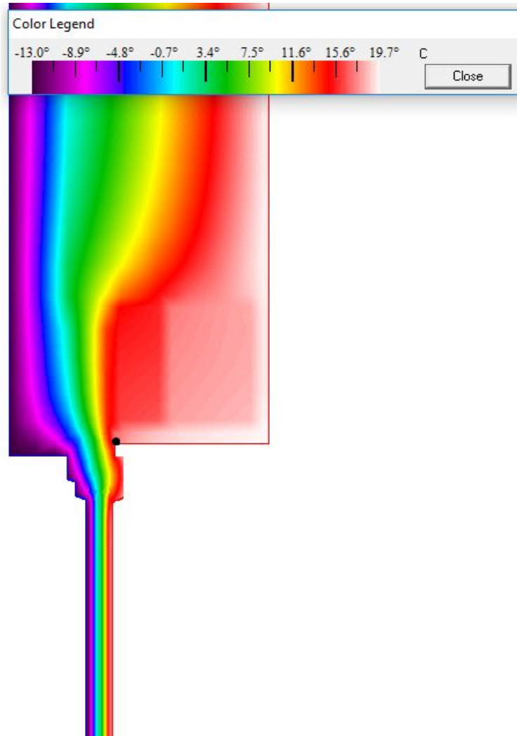
Priebeh teplôt konštrukciou - vykreslenie pomocou teplotného poľa