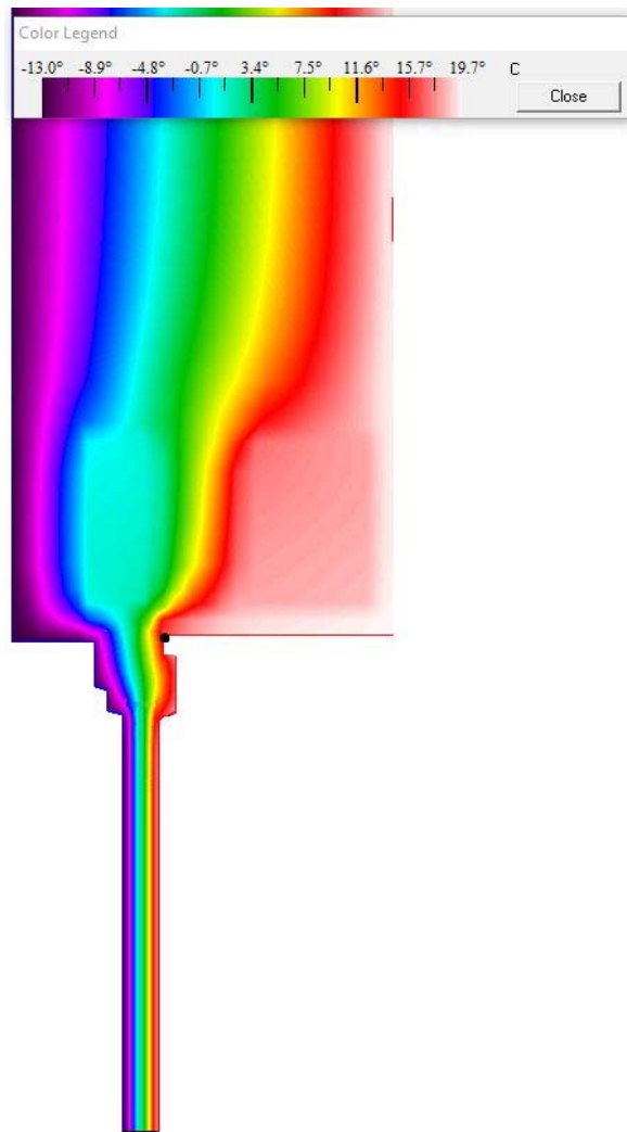
Pribeh teplôt konštrukciou - vykreslenie pomocou teplotného poľa