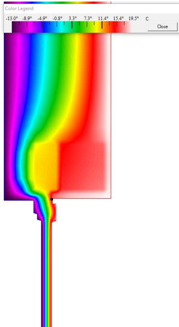
Pribeh teplôt konštrukciou - vykreslenie pomocou teplotného poľa